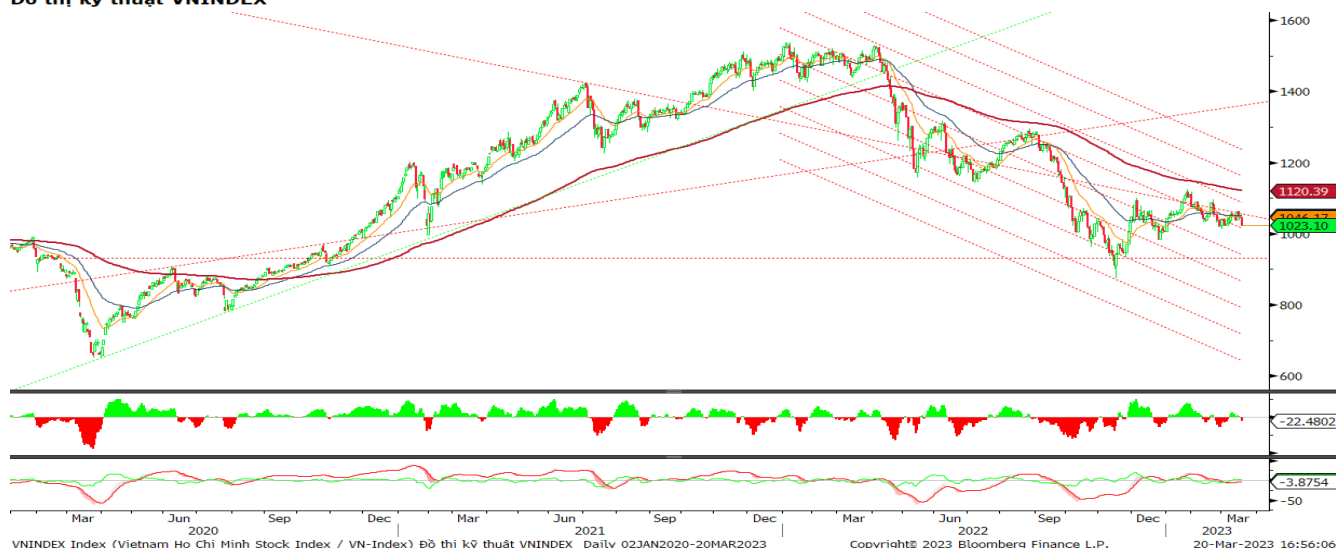
Đồ thị kỹ thuật VNINDEX