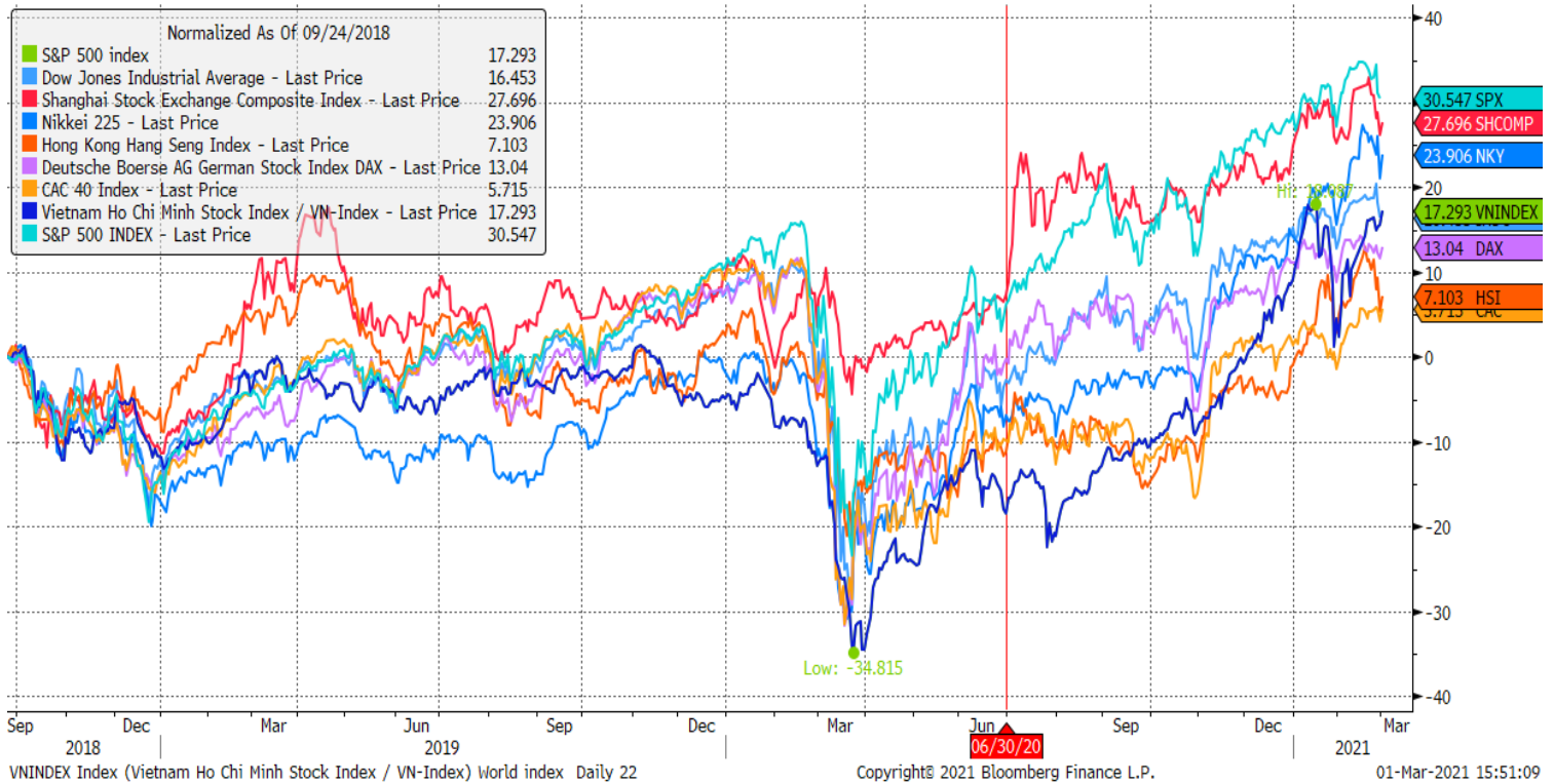
Stock Market Index - Major World Indices