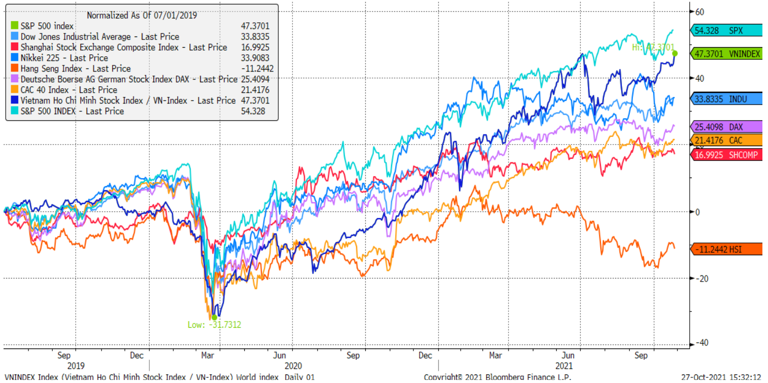
Stock Market Index - Major World Indices