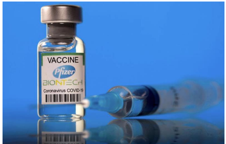
Ảnh minh họa - Ảnh: Reuters.

Nếu được FDA phê duyệt, việc tiêm vaccine Pfizer cho trẻ em thuộc nhóm tuổi trên sẽ là một bước đi quan trọng trong cuộc chiến chống Covid-19 ở Mỹ. Ở thời điểm hiện tại, phần lớn trong số 28 triệu trẻ từ 5-11 tuổi ở Mỹ đã quay trở lại trường để học trực tiếp, thay vì học trực tuyến.