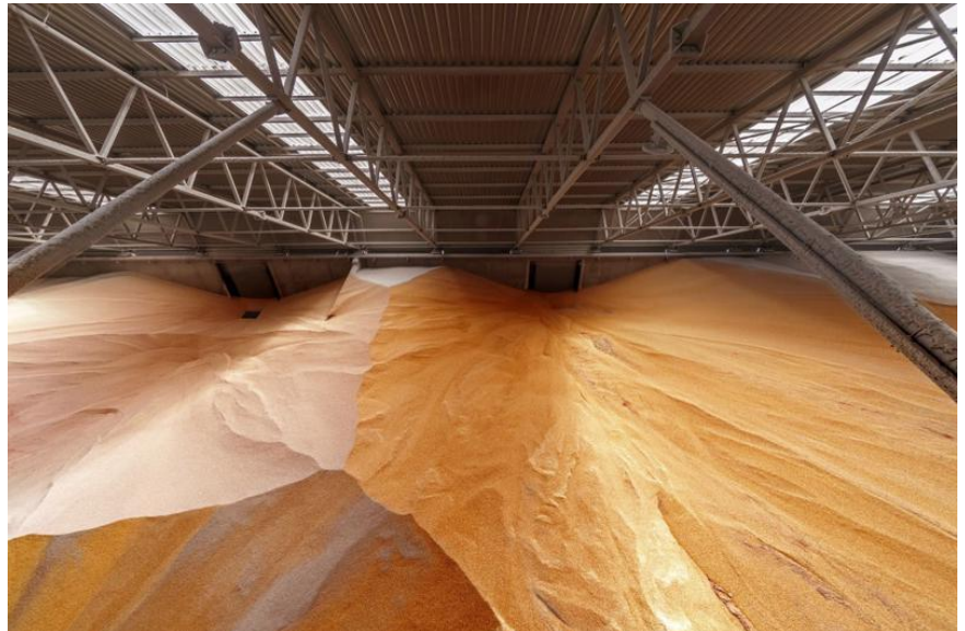
Ngô trong một nhà kho ở cảng Yuzhny, Ukraine, năm 2019 - Ảnh: Bloomberg.

Các biện pháp trừng phạt mạnh tay mà Mỹ và các nước đồng minh áp lên Nga, cộng thêm giá cước tăng vọt của những chuyến tàu chở hàng từ Nga, đang khiến nhiều giao dịch thương mại với nước này rơi vào tình trạng gần như tê liệt. Nga là nước xuất khẩu lớn nhiều hàng hoá cơ bản quan trọng gồm dầu thô, khí đốt, ngũ cốc, phân bón và kim loại.