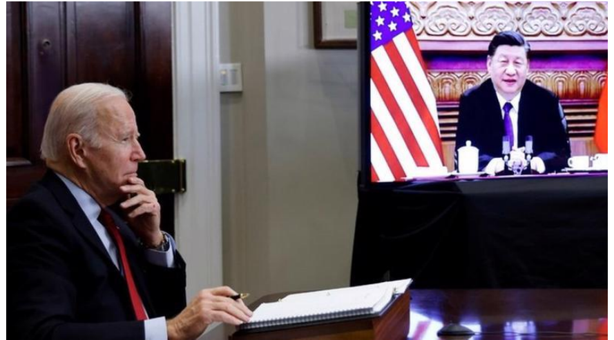
Tổng thống Mỹ Joe Biden (trái) và Chủ tịch Trung Quốc Tập Cận Bình trong cuộc gặp thượng đỉnh trực tuyến ngày 15/11 theo giờ Mỹ

Ông Jake Sullivan, cố vấn an ninh quốc gia Mỹ, cho biết trong cuộc gặp thượng đỉnh trực tuyến vào ngày 15/11 theo giờ Mỹ, hai nhà lãnh đạo đã thảo luận về sự cần thiết phải có các cuộc đàm phán "ổn định chiến lược" về hạt nhân. Trước đó, Trung Quốc từ chối đàm phán hạt nhân với Mỹ, trên cơ sở rằng Mỹ sở hữu kho vũ khí hạt nhân lớn hơn nhiều so với Trung Quốc.