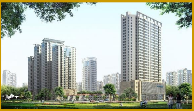
FLC Sea Tower Quy Nhơn Quy mô: 17.345m 2 Tổng đầu tư: 2.349 tỷ đồng Hoàn thành: Quý II/2018