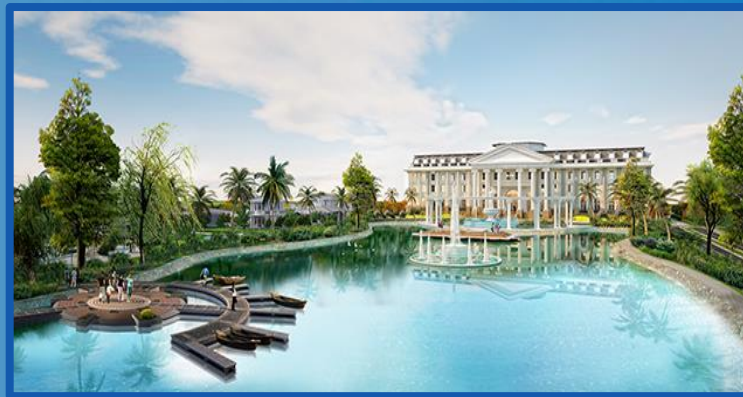
Quần thể FLC Hạ Long, Quảng Ninh Diện tích: 157 ha Tổng mức đầu tư: 10.000 tỷ đồng Hoàn thành Quý IV/2018