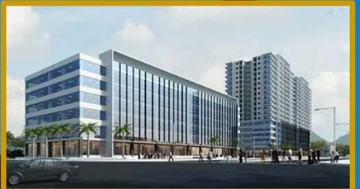
FLC Complex Thanh Hóa Quy mô: 1,6 ha Tổng đầu tư: 1.200 tỷ đồng Hoàn thành: Quý V/2016