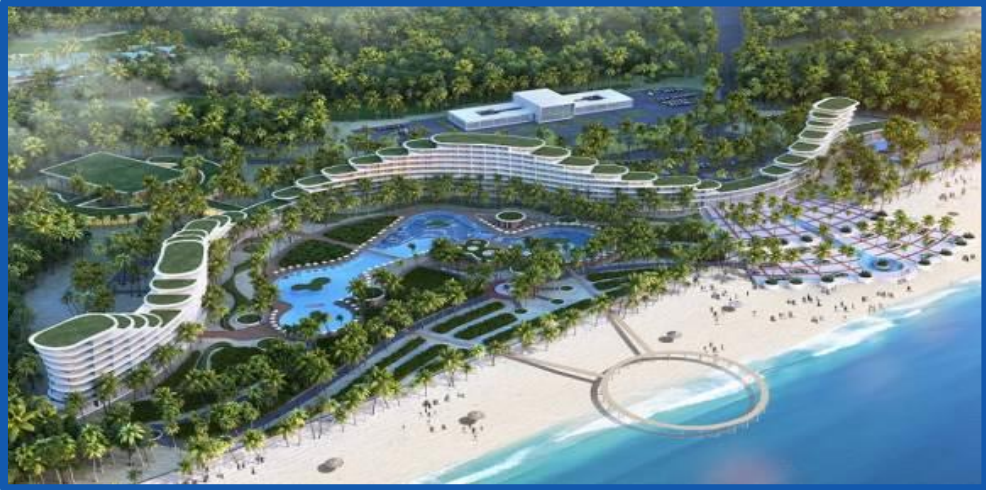
Quần thể FLC Quy Nhơn, Bình Định Diện tích: 1.300 ha Tổng vốn đầu tư (giai đoạn 1): 20.000 tỷ đồng Khánh thành: Quý II/2016