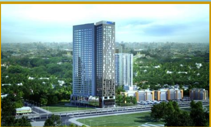
FLC Complex Hà Nội Quy mô: 3.793m 2 Tổng đầu tư: 1.200 tỷ đồng Hoàn thành: Quý IV/2016