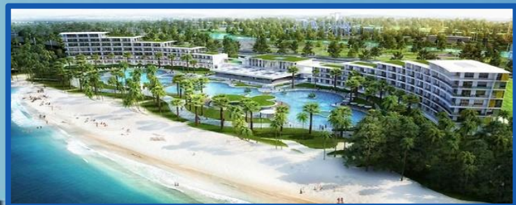
Quần thể FLC Sầm Sơn, Thanh Hóa Diện tích: 200 ha Tổng vốn đầu tư: 12.088 tỷ đồng Hoàn thành: Quý II/2015