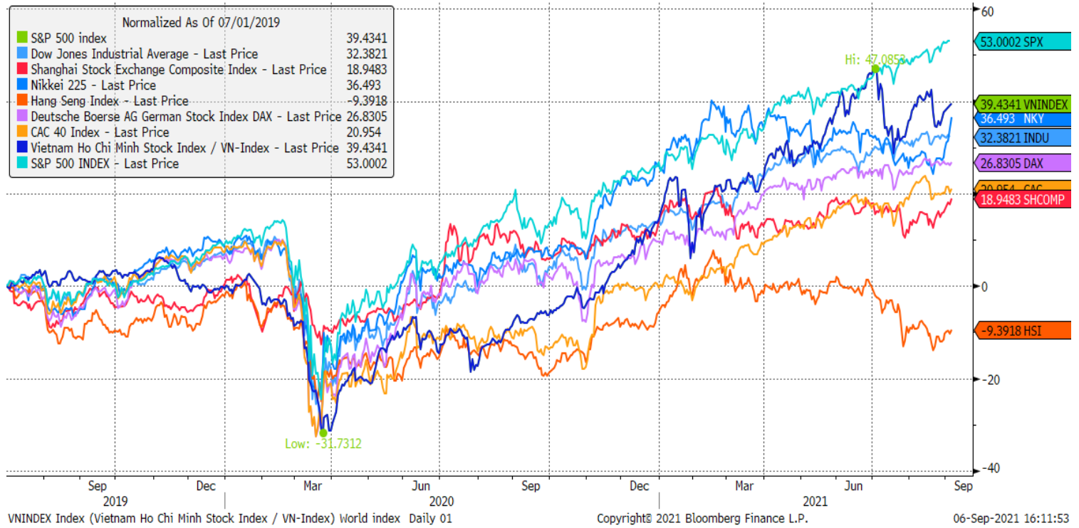
Stock Market Index - Major World Indices