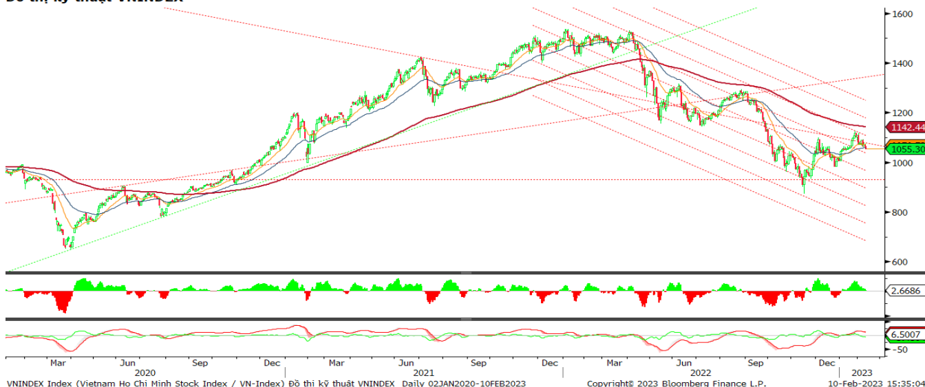
Đồ thị kỹ thuật VNINDEX