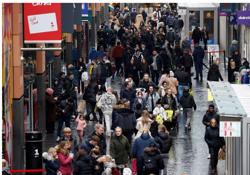
Ảnh minh họa.

Sản lượng tiêu thụ giảm 3,7% so với tháng 11, mức giảm mạnh hơn nhiều so với dự báo giảm 0,6% trong một cuộc thăm dò ý kiến của các nhà kinh tế của Reuters và là mức giảm lớn nhất kể từ tháng 1 năm ngoái khi đất nước đang bị khóa coronavirus.