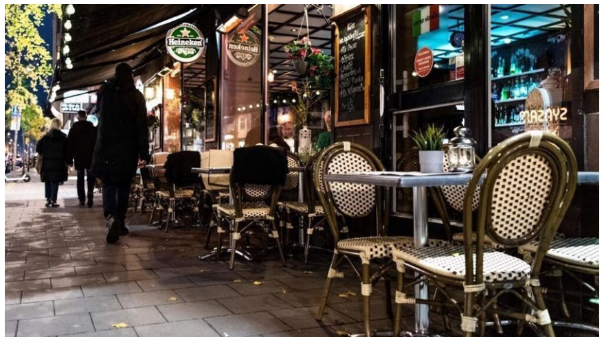
Thụy Điển áp dụng thẻ thông hành Covid-19 từ ngày 1/12

Chính phủ Thụy Điển ngày 17/11 cũng thông báo, từ ngày 1/12, người dân nước này cần có thẻ thông hành Covid để tham gia các sự kiện có hơn 100 người. Đến nay, thẻ thông hành này – chứng nhận rằng một người đã tiêm chủng vaccine đầy đủ, có xét nghiệm âm tính trong 72 giờ hoặc đã khỏi bệnh – được sử dụng cho mục đích đi lại tại Thụy Điển.