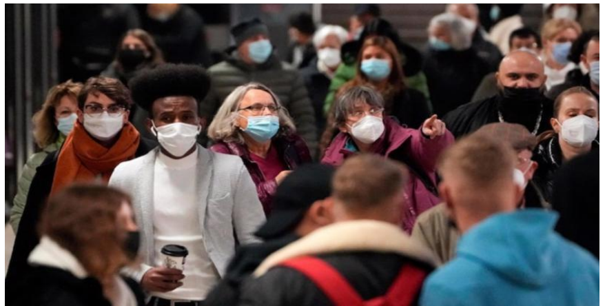
Châu Âu đang một lần nữa trở thành tâm dịch của thế giới

Theo tin từ Bloomberg, Hy Lạp vừa trở thành quốc gia mới nhất thắt chặt các hạn chế với người chưa tiêm vaccine Covid-19 trong bối cảnh số ca nhiễm mới và nhập viện tăng cao đang gây áp lực lớn hệ thống y tế nước này. Trước đó, Đức, Áo, Thụy Điển và nhiều quốc gia châu Âu khác cũng có động thái tương tự nhằm gây áp lực để người dân đi tiêm vaccine nhiều hơn, trong bối cảnh châu Âu đang một lần nữa trở thành tâm dịch của thế giới với số ca nhiễm tăng mạnh.