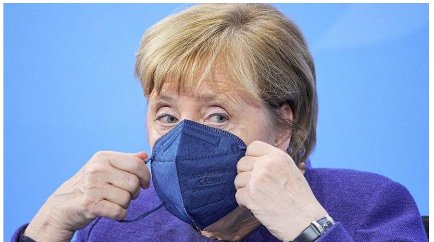
Thủ tướng Đức Angela Merkel

Theo đó, tại các khu vực có nhiều hơn 3 bệnh nhân Covid-19 tại bệnh viện trên 100.000 cư dân, chỉ những người đã tiêm vaccine hoặc đã khỏi bệnh có thể vào các địa điểm công cộng như nhà hàng, rạp hát. Hiện tại, hầu hết các khu vực tại Đức đều có số ca nhiễm Covid-19 ở trên ngưỡng này.