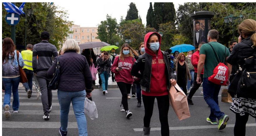
Kể từ khi thắt chặt các biện pháp hạn chế vào đầu tháng 11, Hy Lạp ghi nhận khoảng 100.000 ca nhiễm Covid-19 mới

Từ ngày 22/11, những người chưa tiêm vaccine tại Hy Lạp sẽ không được phép vào các địa điểm trong nhà như rạp chiếu phim, rạp hát, phòng tập gym và bảo tàng. Trước đó, từ đầu tháng 11, những người này cũng không được phép vào nhà hàng, quán bar và quán café.