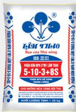
Phân bón NPK-S Lâm Thao 5-10-3+8S