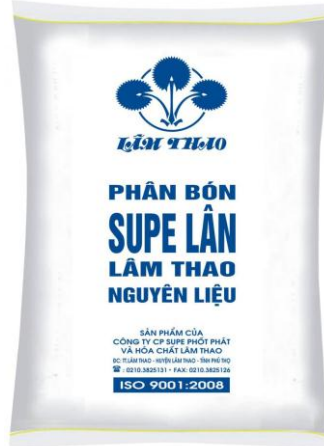
Supe Lân nguyên liệu