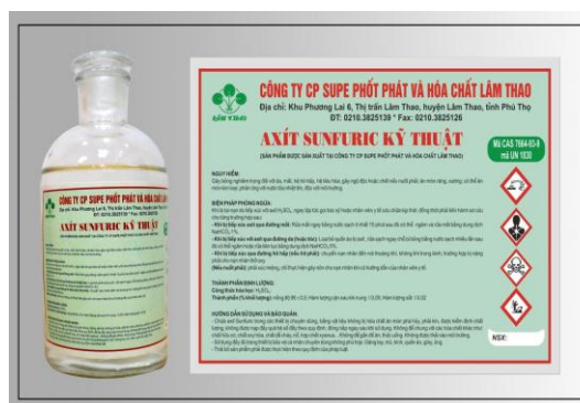
Axit Sunfuric Kỹ thuật

❖ Phân bón hữu cơ khoáng: Thúc đẻ nhánh, đón đòng cho cây trồng; giúp cải tạo đất, tăng độ tơi xốp phì nhiêu cho đất.