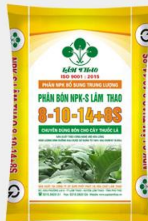
Phân bón NPK-S Lâm Thao 8-10-14+8S

❖ Axit Sunfuric: Các sản phẩm Axit sunfuric của Công ty chủ yếu được dùng để sản xuất phân lân, phần còn lại được Công ty cung cấp ra ngoài thị trường.