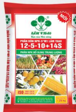
Phân bón NPK-S Lâm Thao 12-5-10+14S