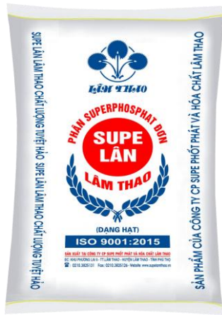
Supe Lân dạng hạt