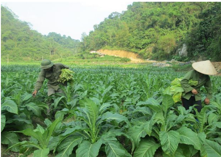
Hình ảnh Thu hoạch cây thuốc lá