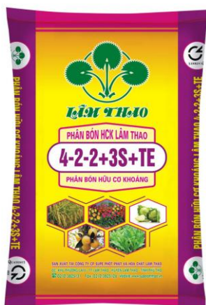
Phân bón Hữu cơ khoáng 4-2-2+3S+TE

❖ Phân bón hữu cơ khoáng: Thúc đẻ nhánh, đón đòng cho cây trồng; giúp cải tạo đất, tăng độ tơi xốp phì nhiêu cho đất.