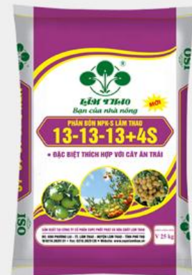
Phân bón NPK-S Lâm Thao 13-13-13+4S