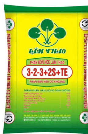
Phân bón Hữu cơ khoáng 3-2-3+2S+TE