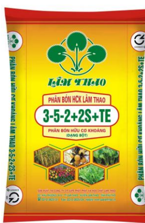
Phân bón Hữu cơ khoáng 3-5-2+2S+TE (Dạng bột)