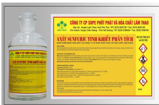
Axit Sunfuric Tinh khiết Phân tích

❖ Axit Sunfuric: Các sản phẩm Axit sunfuric của Công ty chủ yếu được dùng để sản xuất phân lân, phần còn lại được Công ty cung cấp ra ngoài thị trường.