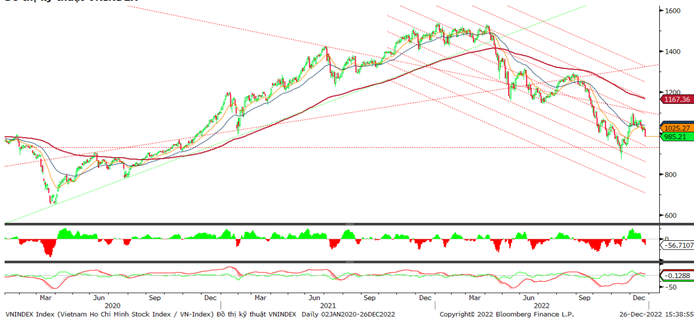
Đồ thị kỹ thuật VNINDEX