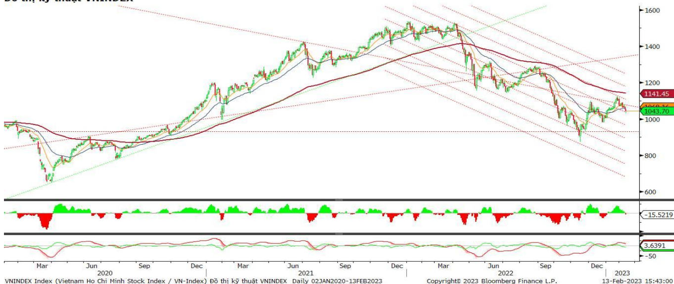
Đồ thị kỹ thuật VNINDEX