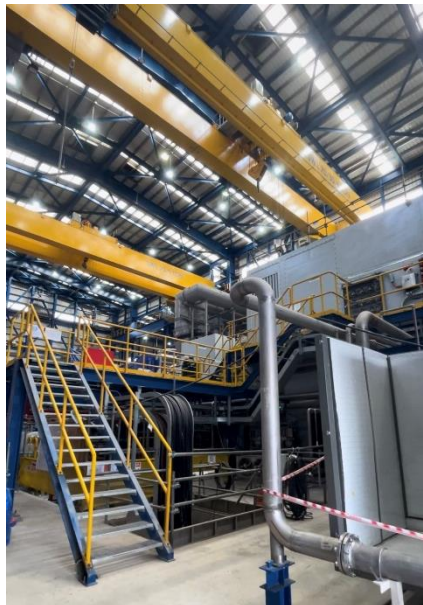
Hình 2: Khu vực tuabin hơi và tuabin khí với khả năng tự động hóa cao