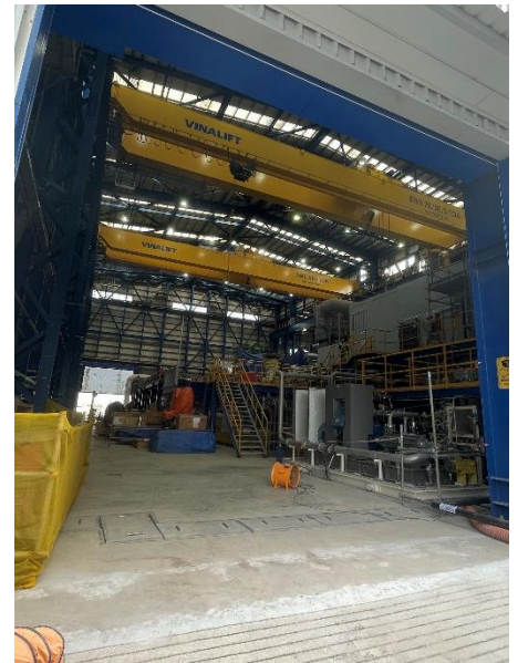
Hình 3: Khu vực tuabin hơi và tuabin khí với khả năng tự động hóa cao