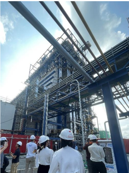
Hình 1: Khu vực lò hơi Nhon Trạch 3&4