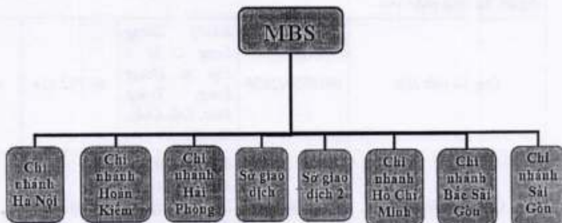
Hình 4: Mạng lưới của công ty.