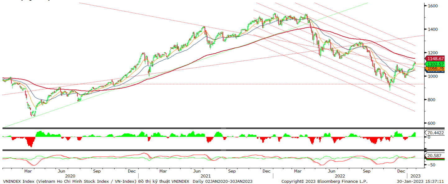
Đồ thị kỹ thuật VNINDEX