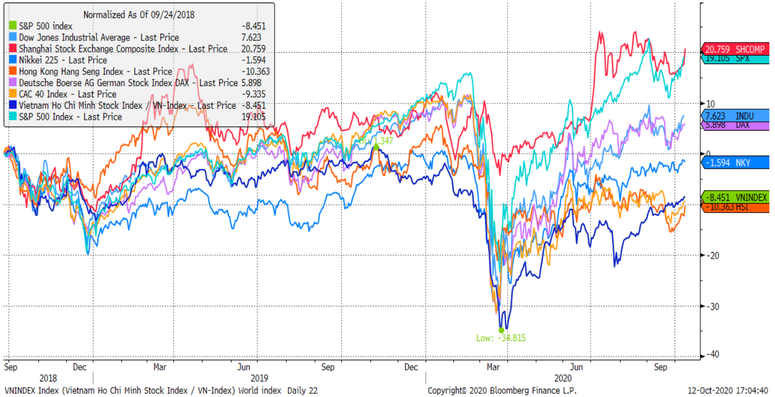
Stock Market Index - Major World Indices