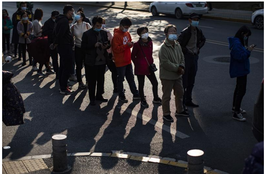
Người dân xếp hàng chờ tiêm vaccine Covid ở Vũ Hán - Ảnh: Bloomberg.

Tờ China Daily ngày 23/11 cho biết trong ngày 22/11, Trung Quốc phát hiện 5 ca nhiễm Covid mới trong cộng đồng và 14 ca nhập cảnh. Trước đó, vào ngày 21/11, nước này có 7 ca trong cộng đồng và 31 ca nhập cảnh.