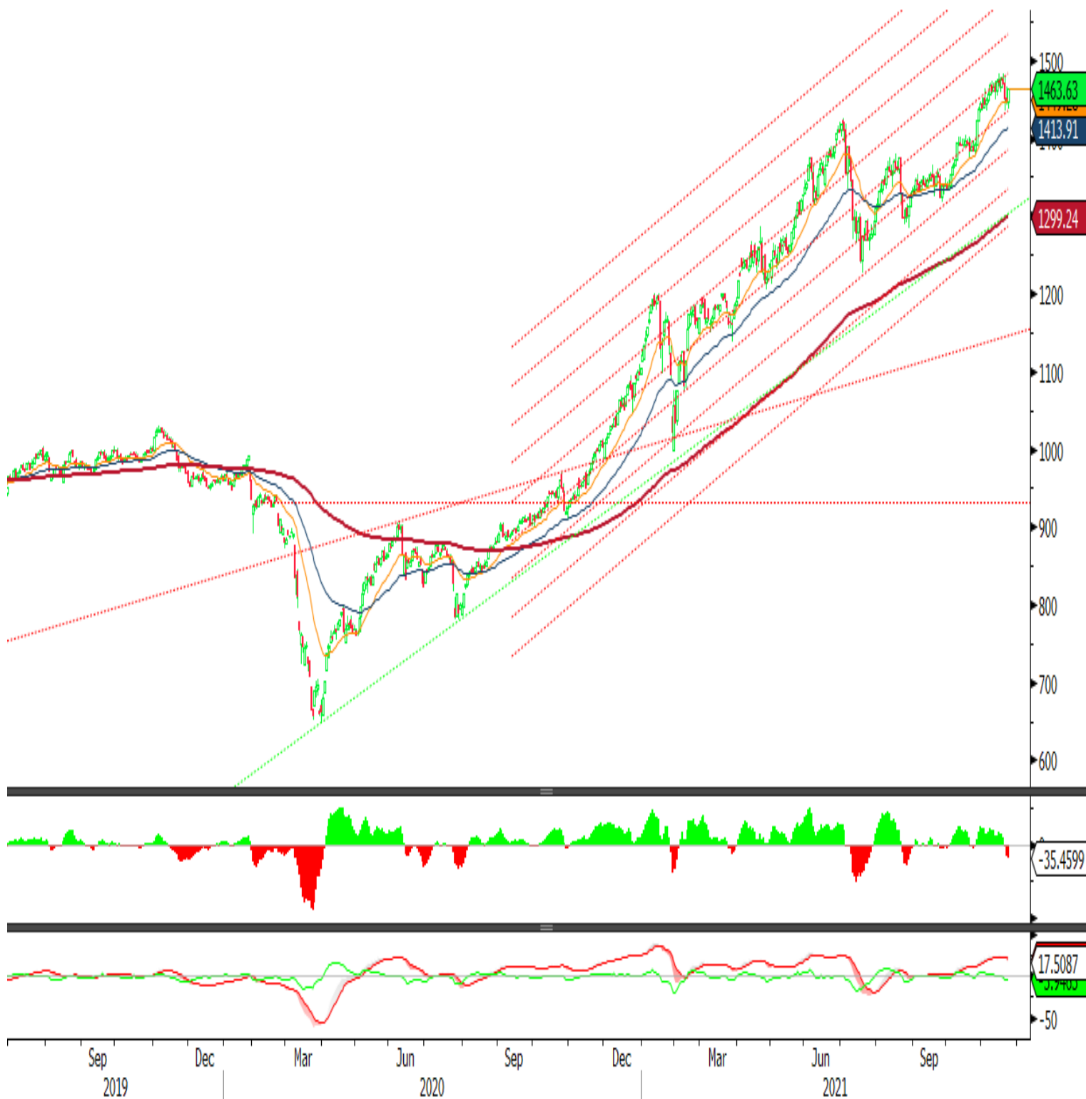
VNINDEX Index (Vietnam Ho Chi Minh Stock Index / VN-Index) Đồ thị kỹ thuật VNINDEX Daily 01JUL2019-23NOV2021