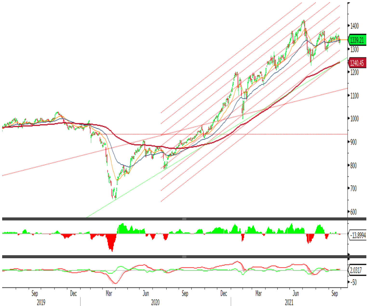
VNINDEX Index (Vietnam Ho Chi Minh Stock Index / VN-Index) Đồ thị kỹ thuật VNIND