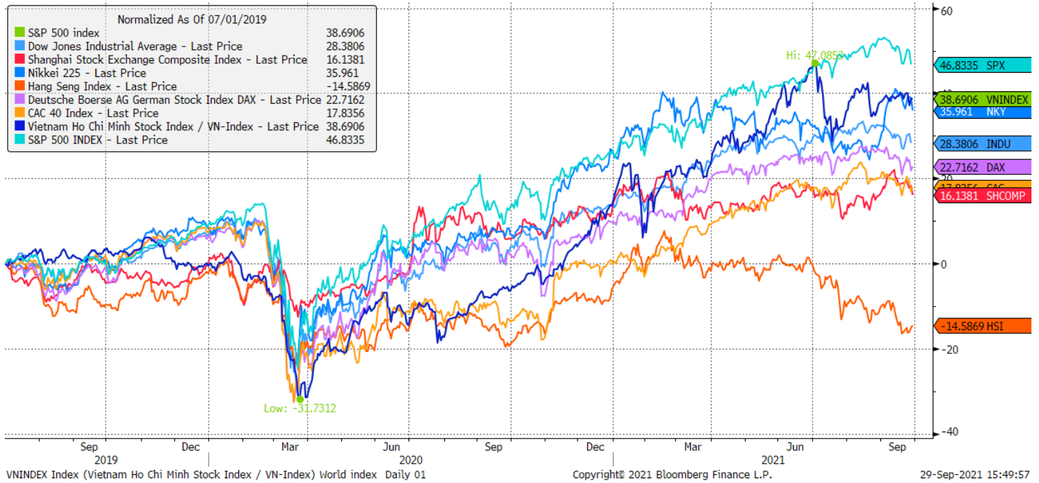
Stock Market Index - Major World Indices