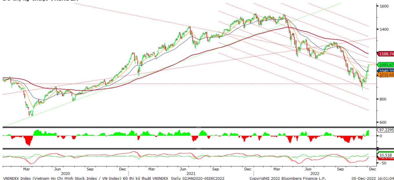
Đồ thị kỹ thuật VNINDEX