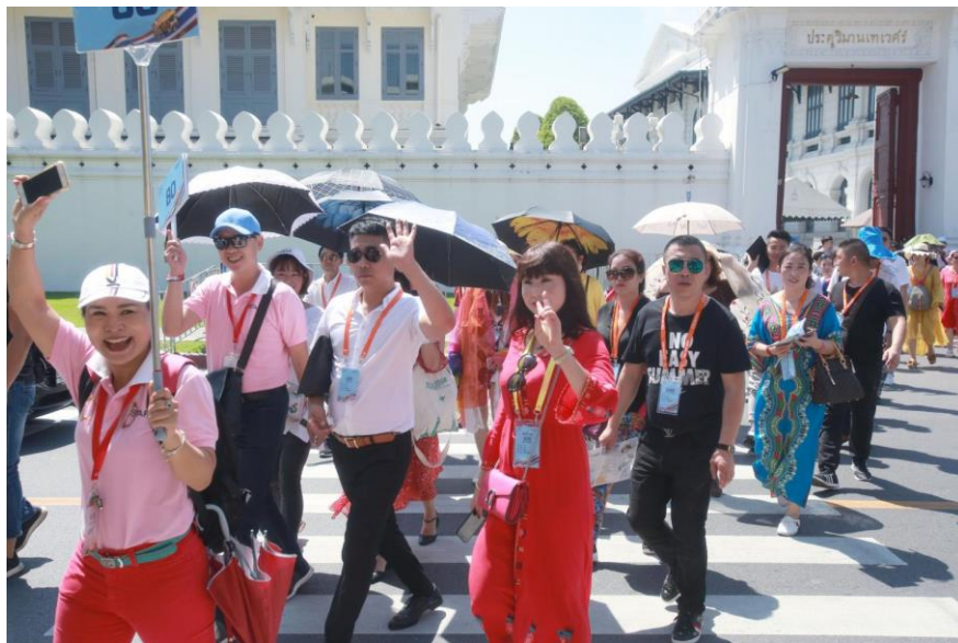
Du khách Trung Quốc tham quan cung điện Hoàng gia Thái Lan trong thời kỳ chưa hạn chế du lịch.

Theo báo cáo của Hotels & Hospitality Group thuộc Công ty tư vấn bất động sản toàn cầu Jones Lang Lasalle (JLL), chính sách hạn chế du lịch của Trung Quốc có thể gây tổn thất từ 10-20 điểm phần trăm đối với tỉ lệ lấp đầy phòng ở ngành khách sạn tại một số thành phố ở khu vực ASEAN.